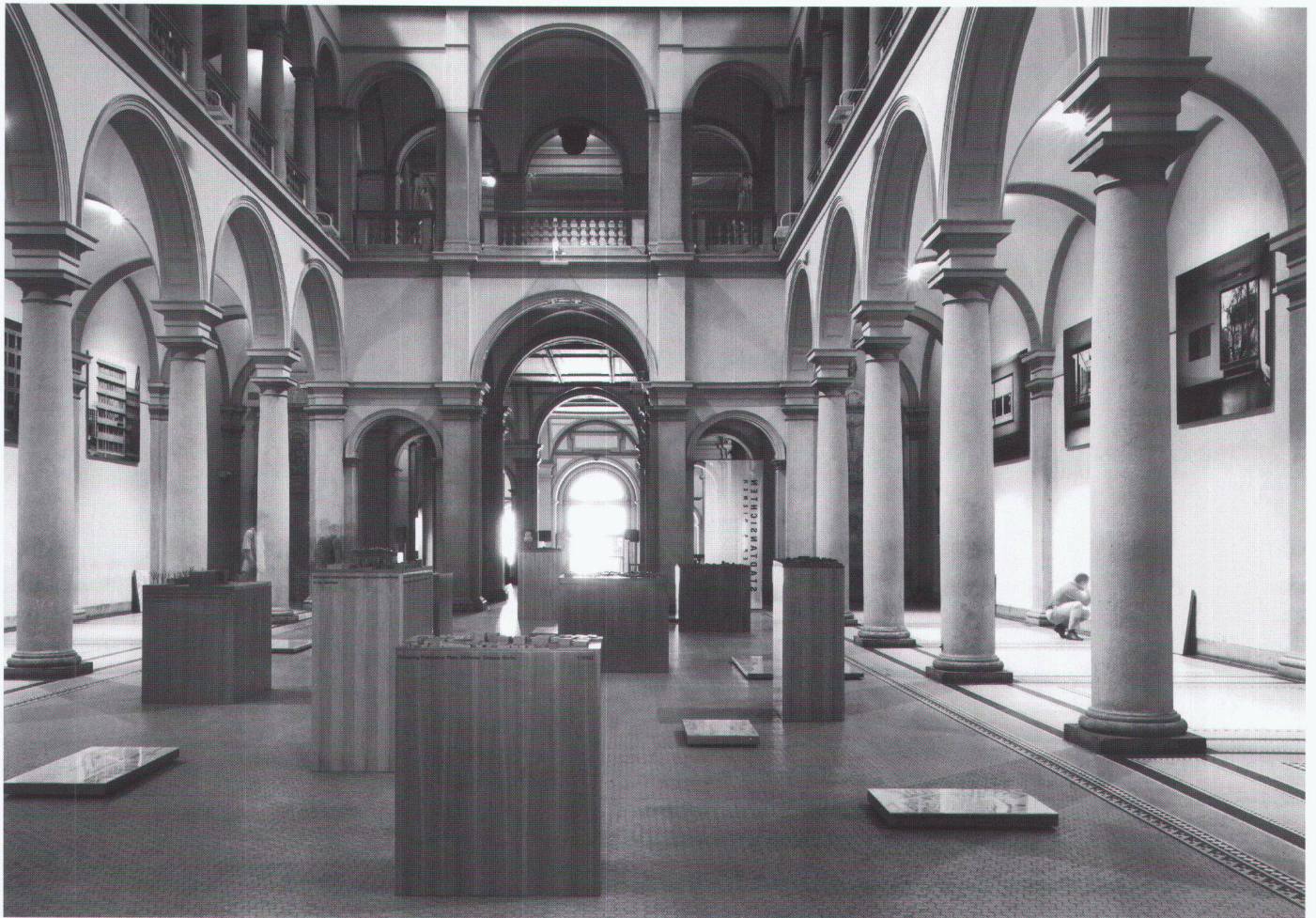
Die Ausstellungssituation als Rauminterpretation an der ETH Zürich

an. «Stadtansichten» sollte methodologisch dem Ausstellungsstandort ETH Rechnung tragen und zugleich eine Diskussion über die Darstellungsformen von Architektur anregen. So legte das Ausstellungskonzept Wert auf eine Kontinuität der Wahrnehmung der sechs Bauten, die in der grossen Bildserie fotogrammetrisch festgehalten sind: Wie ein Moebius-Band sollte das Wechselspiel von innen nach aussen und zurück die übergeordnete Thematik der urbanen Fügungs- und Formprinzipien veranschaulichen. Darin erscheint selbst die Innenaufnahme einer Fenstersituation als lokale Ausprägung in einem Wahrnehmungskontinuum, das die Beziehung von Wand und Öffnung, Form und Inhalt neu ausloten will. Zugleich stellt die Darstellungsweise den kulturellen Spannungszustand zwischen Einzelobjekt und Stadtganzem zur Diskussion.